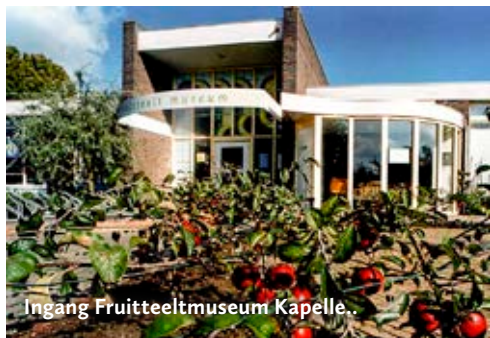
Ingang Fruitteeltmuseum Kapelle.

Annie M.G.Schmidtsingel 1 4421 TA Kapelle Tel. 0113-344904