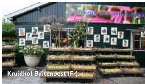
Kruidhof Buitenpost (Fr).

Doelstelling van de Historische Tuin is het in stand houden van vroeger geteelde gewassen en vroegere opstanden, het bewaren van oude teeltwijzen en het verzamelen van documenten, voorwerpen en materialen die uit het tuinbouwhistorisch oogpunt vooral voor Aalsmeer van belang zijn. Bij de opzet en inrichting van de Historische Tuin staat de historische waarde voorop en worden de teeltmethodes en cul-