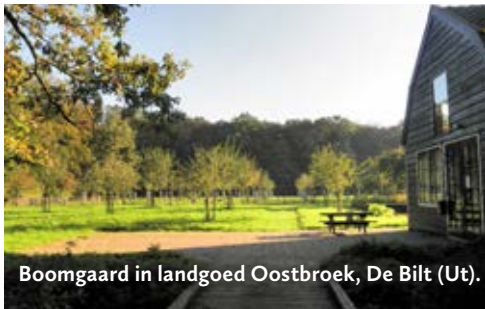
Boomgaard in landgoed Oostbroek, De Bilt (Ut).

Straatweg 25, 3621 BG Breukelen www.nyenrode.nl Boomgaard in het zuidwesten van het park, op een groot omgracht rechthoekig terrein. Park toegankelijk.