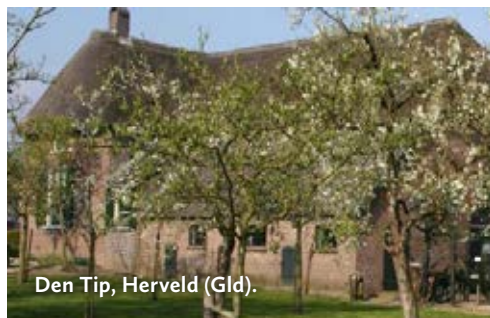
Den Tip, Herveld (Gld).

Merkenhorststraat 2, 6674 AH Herveld Rondom de boerderij ligt een mooie tuin, met veel fruitbomen.