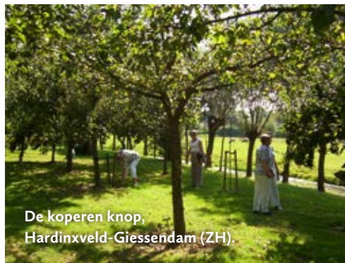
De koperen knop, Hardinxveld-Giessendam (ZH).

Koningspade 31, 1718 MP Hoogwoud Hoogstamboomgaard met oude fruitrassen.