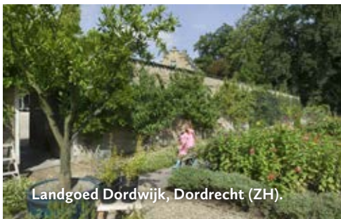
Landgoed Dordwijk, Dordrecht (ZH).