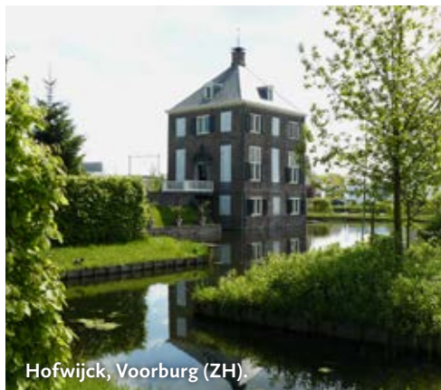
Hofwijck, Voorburg (ZH).

Keukenhof 1, 2161 AN Lisse www.kasteelkeukenhof.nl Boomgaarden en fruitmuur met leifruit. Entree. Vanaf mei tot sept. alleen op maandag rondleiding.