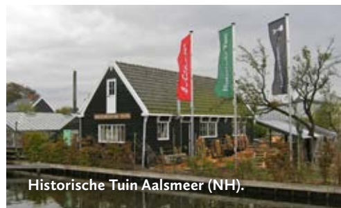
Historische Tuin Aalsmeer (NH).

Rijksstraatweg 109 8121 SR Den Nul (0570) 745040