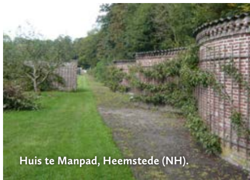
Huis te Manpad, Heemstede (NH).