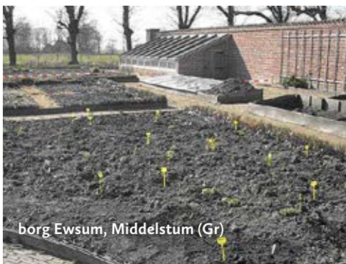
borg Ewsum, Middelstum (Gr)

Tuinmuur met druivenkas en jong leifruit. Museum.