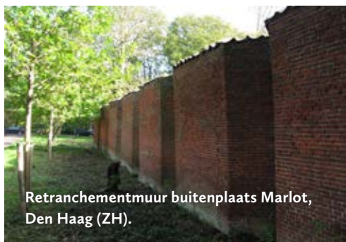
Retranchementmuur buitenplaats Marlot, Den Haag (ZH).

plaats daarvan heeft de muur terugspringende rechte muurvlakken die onderling verbonden zijn met een schuine hoek.