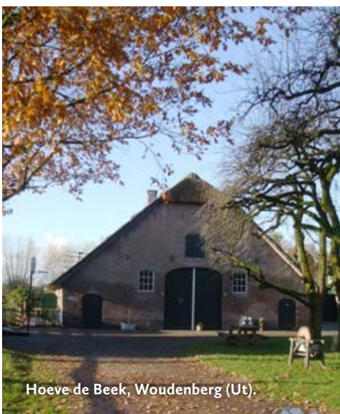
Hoeve de Beek, Woudenberg (Ut).

Streek- en stadshistorische collectie Geinoord 11, 3432 PE Nieuwegein Achter de monumentale boerderij is een groot zg. natuurkwartier ingericht waarin een grote perenboomgaard van 1 hectare met 200 hoogstamperen is opgenomen.