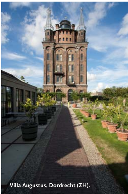
Villa Augustus, Dordrecht (ZH).