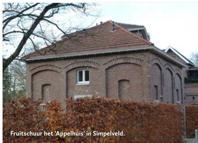
Fruitschuur het 'Appelhuis' in Simpelveld.