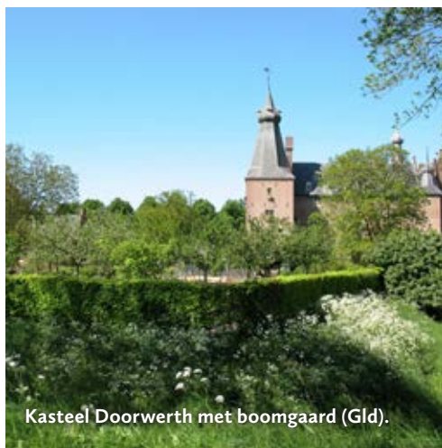
Kasteel Doorwerth met boomgaard (Gld).