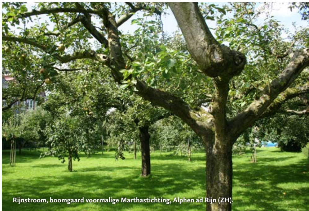
Rijnstroom, boomgaard voormalige Marthastichting, Alphen ad Rijn (ZH).