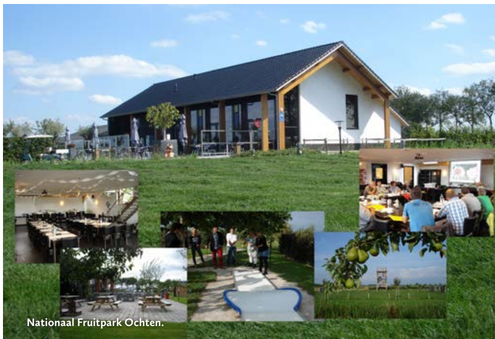
Nationaal Fruitpark Ochten.