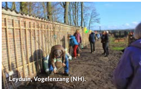
Leyduin, Vogelenzang (NH).