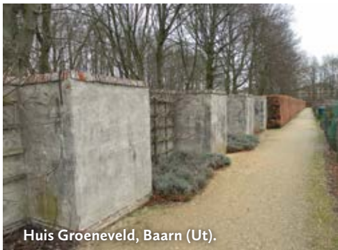
Huis Groeneveld, Baarn (Ut).

Amsterdamsestraatweg 42, 3741 GS Baarn Bepleisterde en opnieuw net leifruit beplante muur 1730. Museum. Landgoed vrij toegang.