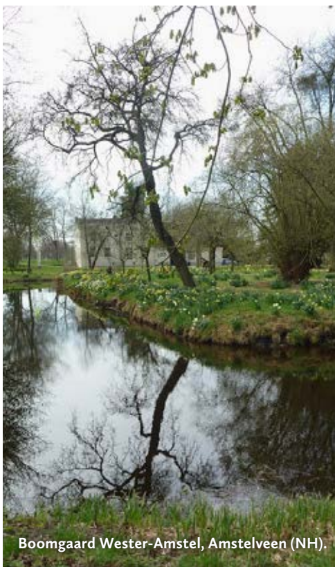
Boomgaard Wester-Amstel, Amstelveen (NH).

Exposities. Tijdens kantooruren park vrij toegang.