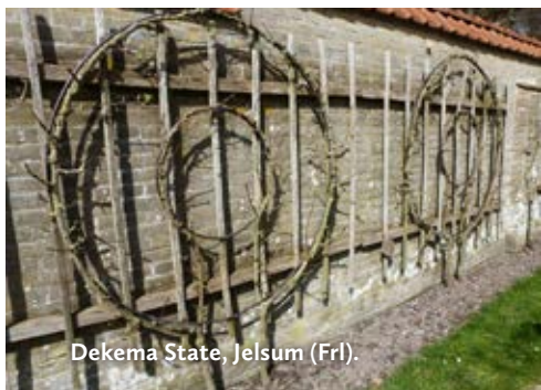
Dekema State, Jelsum (Fr).