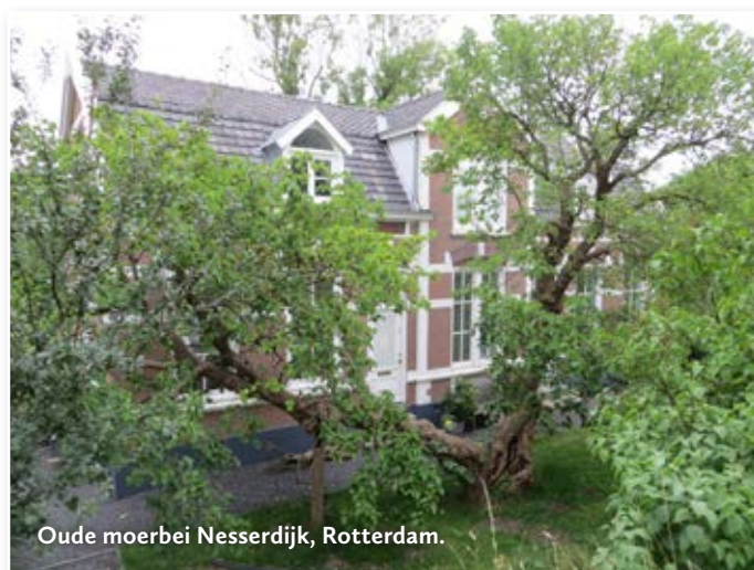
Oude moerbeï Nesserdijk, Rotterdam.