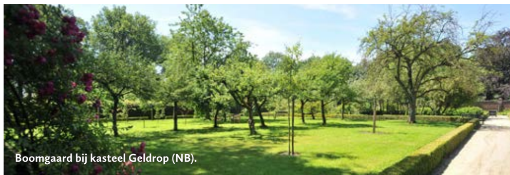
Boomgaard bij kasteel Geldrop (NB).

Terrein vrij toegang. Iets ten oosten van het huidige kasteeltje Cranendonck aan de Bulder Aa.