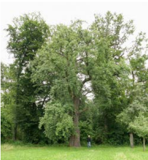
Dikste perenboom van Duitsland in Klein Villars bij Pforzheim (omtrek 5,40 m).