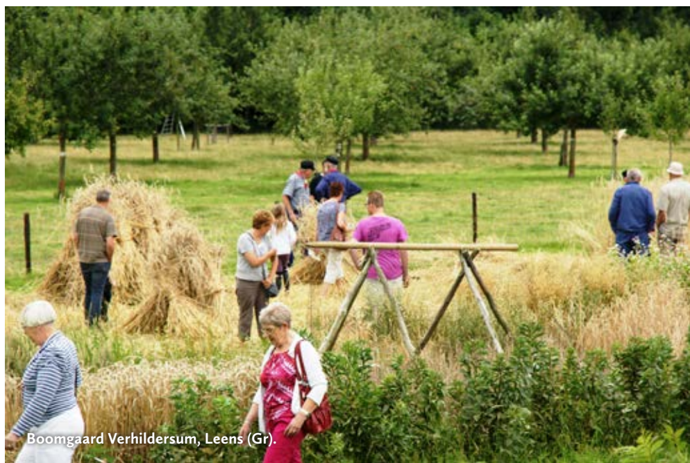
Boomgaard Verhildersum, Leens (Gr).

Het is verstandig de website (indien aanwezig) van een buitenplaats te raadplegen over data van openstelling en bezoekvoorwaarden. Soms is een toegangskaart of donateursbewijs nodig.