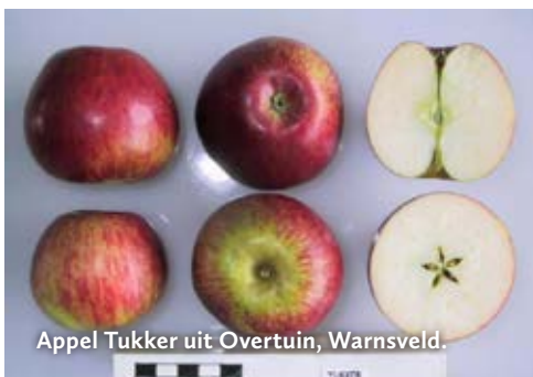
Appel Tukker uit Overtuin, Warnsveld.