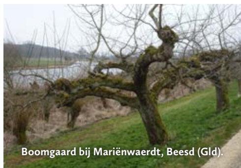
Boomgaard bij Mariënwaerd, Beesd (Gld).