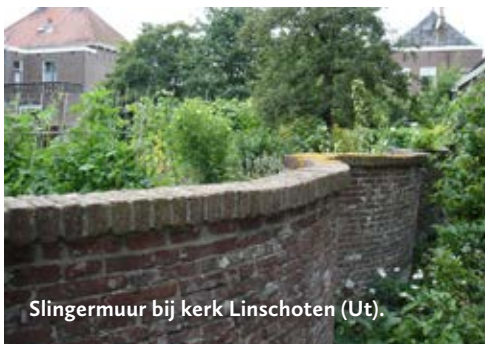
Slingermuur bij kerk Linschoten (Ut).

Zuidelijk van de Grote of Sint-Janskerk te Linschoten 18e-eeuwse slingermuur, vermoedelijk rond 1770 gebouwd. Zonder leifruit. Vrij toegang.