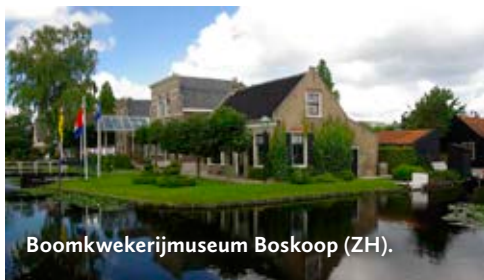
Boomkwekerijmuseum Boskoop (ZH).

tot het belangrijkste boomkwekerijcentrum. Er staan o.a. oude appel- en perenrassen, treurbomen, azalea's, aardbeienplanten, oude rozensoorten en in mooie vormen geknipte buxussen. In de tuin is te zien hoe de bomen en planten rond 1900 werden vermeerderd en gekweekt.