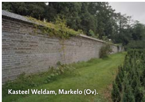
Kasteel Weldam, Markelo (Ov).

Diepenheimseweg 114, 7475 MN Markelo www.weldam.nl Tuinmuren met leifruit. Entree tuinen op werkdagen tegen betaling.