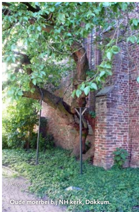
Oude moerbe bij NH kerk, Dokkum.