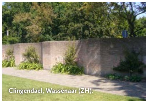
Clingendael, Wassenaar (ZH).

Dorpstraat 51, 3461 CR Linschoten Nu erfscheiding. 18e eeuw. Plaatselijk bekend als abrikozenmuur. Zonder leifruit. Vrij toegang.