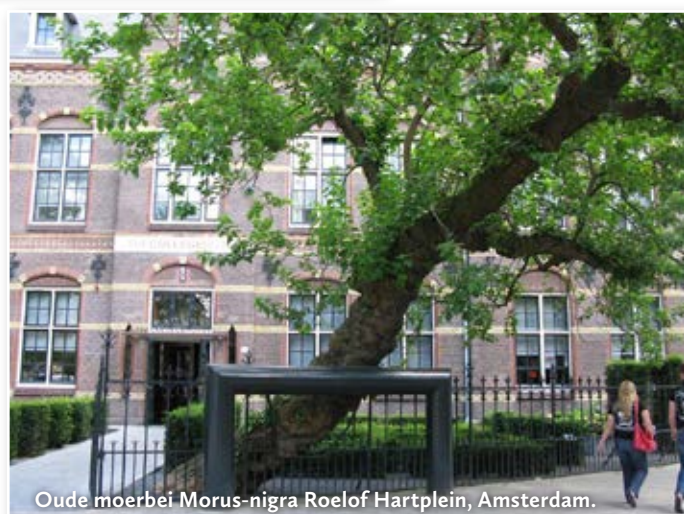
Oude moerbeï Morus-nigra Roelof Hartplein, Amsterdam.