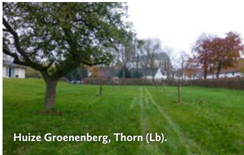
Huize Groenenberg, Thorn (Lb).

Weert 23, 6222 PG Maastricht www.vaeshartelt.nl Jonge boomgaard bij boerderij naast het slot. In de zg. geheime tuin o.a. noten en kweeperen. Conferentiecentrum. Park vrij toegang.