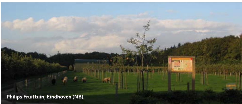
Philips Fruittuin, Eindhoven (NB).

Alleen toegankelijk tijdens excursies, tel. (035) 6559911.