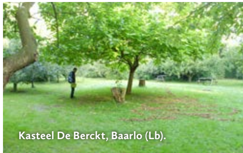
Kasteel De Berckt, Baarlo (Lb).