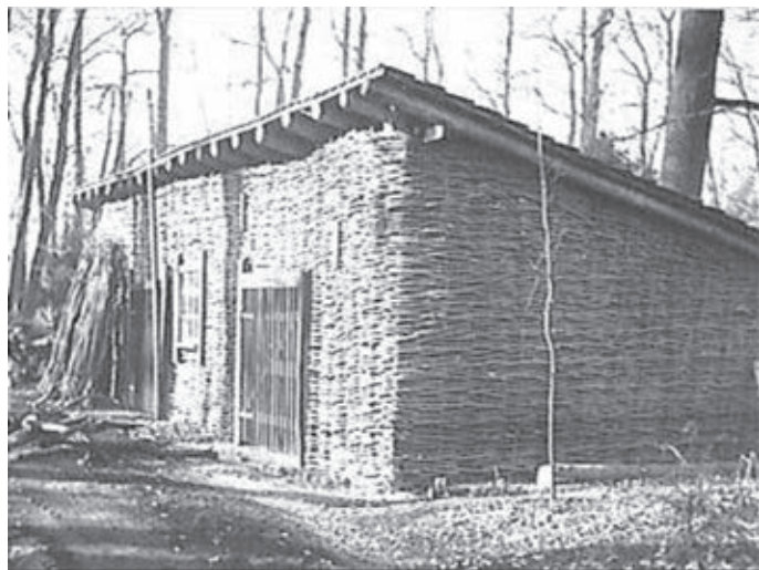
Fruitschuur, Neerijnen historische foto.