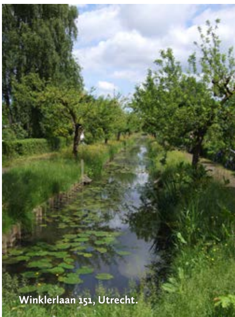
Winklerlaan 151, Utrecht.

De boomgaard is als volgt te bereiken. Met GVVU-buslijn 6 of 36 kunt u uitstappen bij halte J.M. de Muinck Keizerlaan. Vervolgens gaat u de Vecht over, richting de 1e Polderweg. Na de brug gaat u rechtsaf en vervolgens de eerste links, de 1e Polderweg op. Statige populieren aan beide zijden van de weg begeleiden u naar Fort aan de Klop. Een houten bruggetje leidt naar boomgaard De Klop.