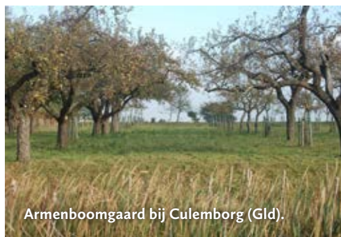
Armenboomgaard bij Culemborg (Gld).

Armenboomgaard in bezit gekomen van de rooms-katholieke kerk in Culemborg en de opbrengst ging naar de armen. Er staan hoogstambomen van verschillende oude rassen. Iedereen mag er nu fruit plukken of oprapen. Nog steeds groeien er oude appel- en perenrassen zoals zoete Bloemée, Sterappel, Jasappel, Gieser Wildeman en Noord-Hollandse Suikerpeer. Onder de bomen grazen schapen. Het gebied met bijzondere landschapselementen, zoals de Armenboomgaard en de begeleidende knotwilgenrij, blijft vrij toegankelijk.