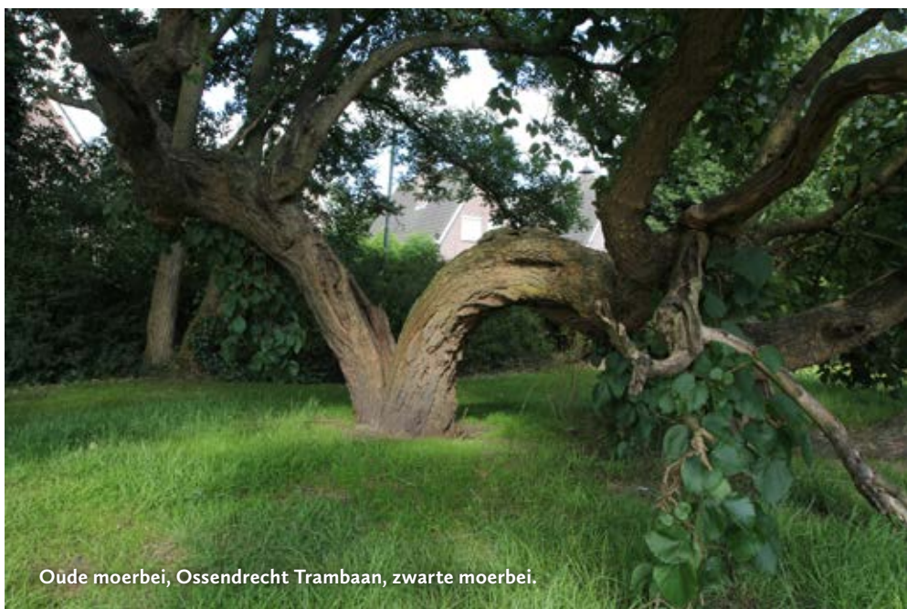
Oude moerbeï, Ossendrecht Trambaan, zwarte moerbeï.

Plein 48, 4001 LJ Tiel www.streekmuseumtiel.nl