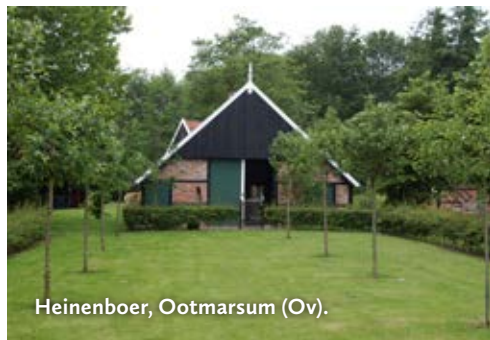
Heinenboer, Ootmarsum (Ov).