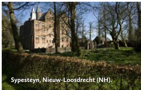
Sypesteyn, Nieuw-Loosdrecht (NH).