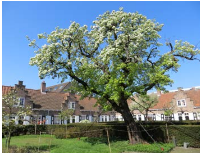
Oudste perenboom van Nederland: Heilig Geesthofje te Den Haag (1647).