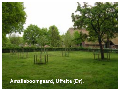
Amaliaboomgaard, Uffelte (Dr).