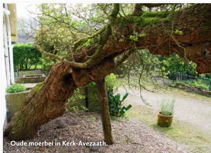
Oude moerbeï in Kerk-Avezaath.