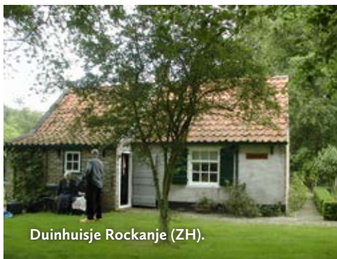
Duinhuisje Rockanje (ZH).

Milderspaat 1, 6034 PL Nederweert Erf met hoogstamfruitbomen.