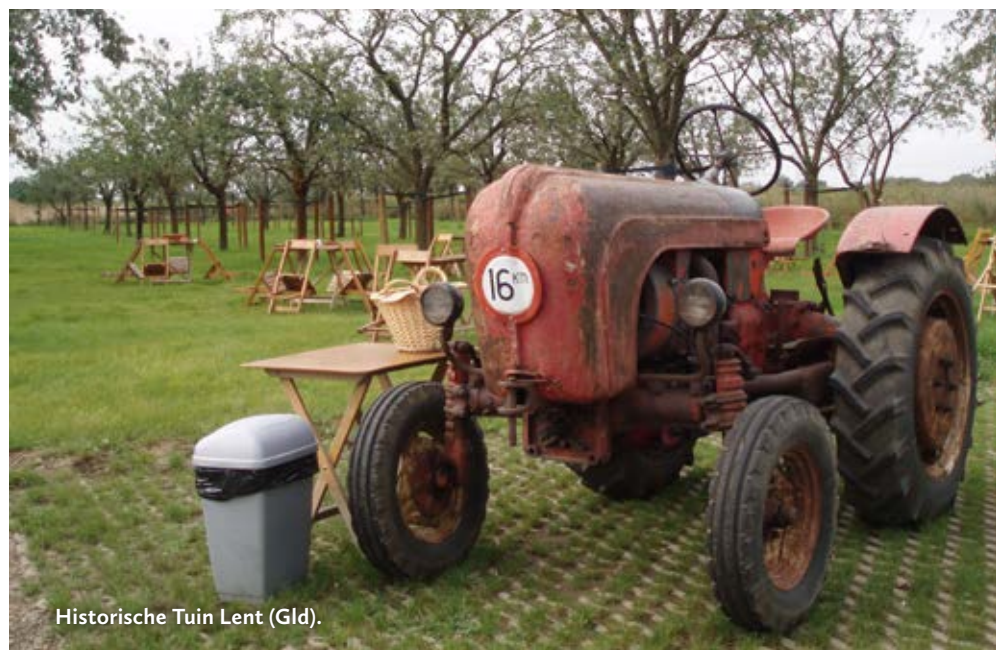
Historische Tuin Lent (Gld).

Het boomkwekerijmuseum geeft u een beeld van de geschiedenis van de boomkwekerij. Er is een vaste tentoonstelling met originele voorwerpen, foto's en documenten over de ontwikkeling van de boomkwekerij vanaf de middeleeuwen tot de hedendaagse moderne sierteelt. De boomkwekerswoning die aan het museum grenst, geeft nauwgezet weer hoe een boomkwekersgezin rond 1900 woonde en leefde onder omstandigheden die tegenwoordig nauwelijks voor te stellen zijn. In de museumkwekerij krijgt de bezoeker de bomen en planten te zien die in de loop van vijf eeuwen ertoe hebben bijgedragen dat Boskoop zich kon ontwikkelen