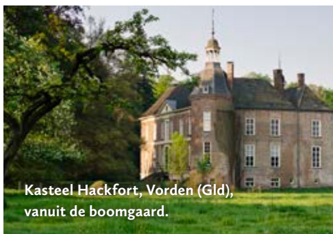
Kasteel Hackfort, Vorden (Gld), vanuit de boomgaard.

Binnenweg 2, 6644 KD Ewijk www.doddendaal.nl Boomgaard en rij notenbomen aan de dijk. Hotel-restaurant.