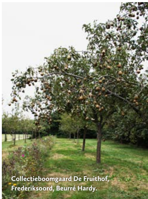
Collectieboomgaard De Fruithof, Frederiksoord, Beurré Hardy.

Secretariaat: Oosterweg M 3 1482 AH Purmer Tel. 06 8123 8094. E-mail: secretariaat@hoogstamfruitnh.com