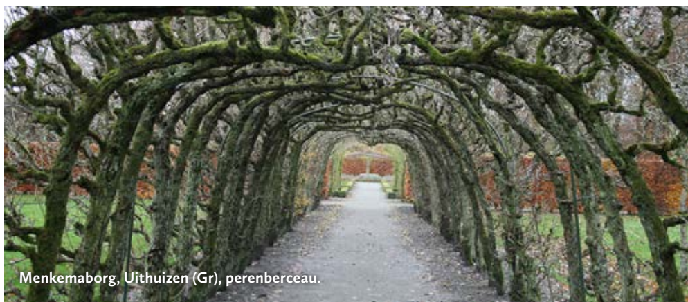
Menkemaborg, Uithuizen (Gr), perenberceau.