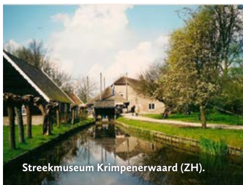
Streekmuseum Krimpenerwaard (ZH).