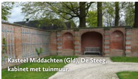
Kasteel Middachten (Gld), De Steeg, kabinet met tuinmuur.

Koninklijk park 1, 7315 JA Apeldoorn www.paleishetloo.nl Gereconstrueerde fruitmuren. Museum.