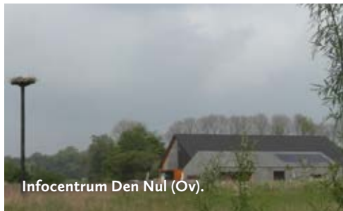
Infocentrum Den Nul (Ov).

Maas en Waal heeft een lange en respectabele traditie op fruitteeltgebied. Zowel wat betreft hard als zacht fruit. Lokaal zijn rassen ontwik-