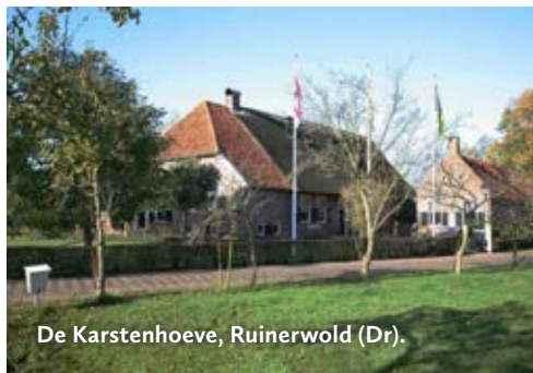
De Karstenhoeve, Ruinerwold (Dr).