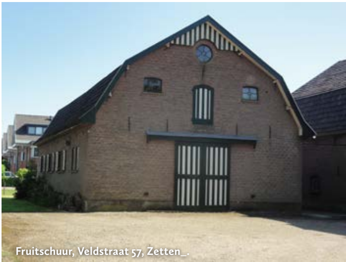
Fruitschuur, Veldstraat 57, Zetten_.