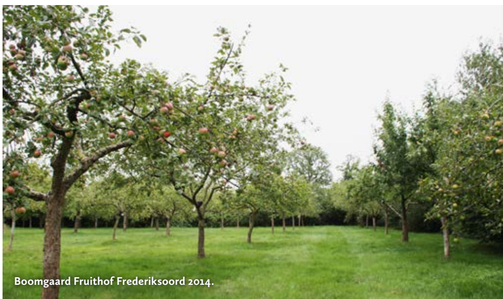
Boomgaard Fruithof Frederiksoord 2014.

Het is aan te raden de websites van genoemde collectieboomgaarden te raadplegen voor actuele informatie, zoals openingsdata en entreprijzen.