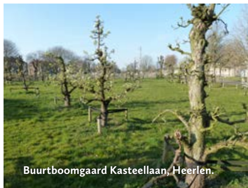
Buurtboomgaard Kasteellaan, Heerlen.