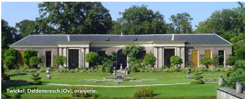
Twickel, Deldeneresch (Ov), oranje- rie.

Deventerdijk 10, 7478 RR Diepenheim www.nijenhuiswesterflier.nl Dubbellandgoed met Nijenhuis te Diepenheim. Boomgaard. Rondleidingen in tuinen tegen betaling, zie website.