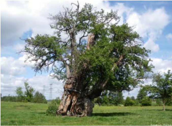
Dikste perenboom van Frankrijk: Chateau de Vardes bij Vardes (omtrek 6,20 m).